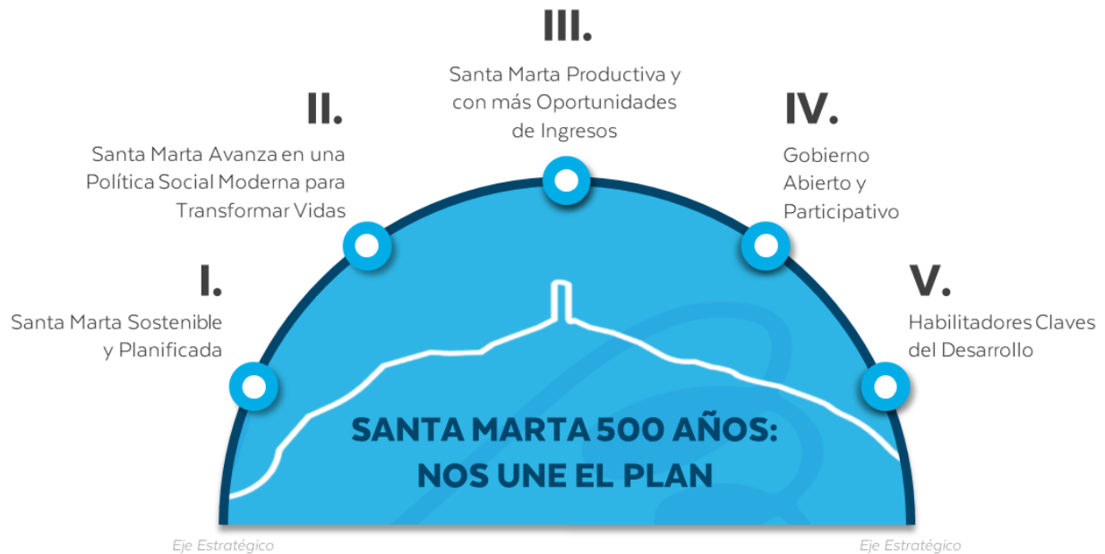
Ilustración 1. Ejes Estratégicos del Plan de Desarrollo Distrital