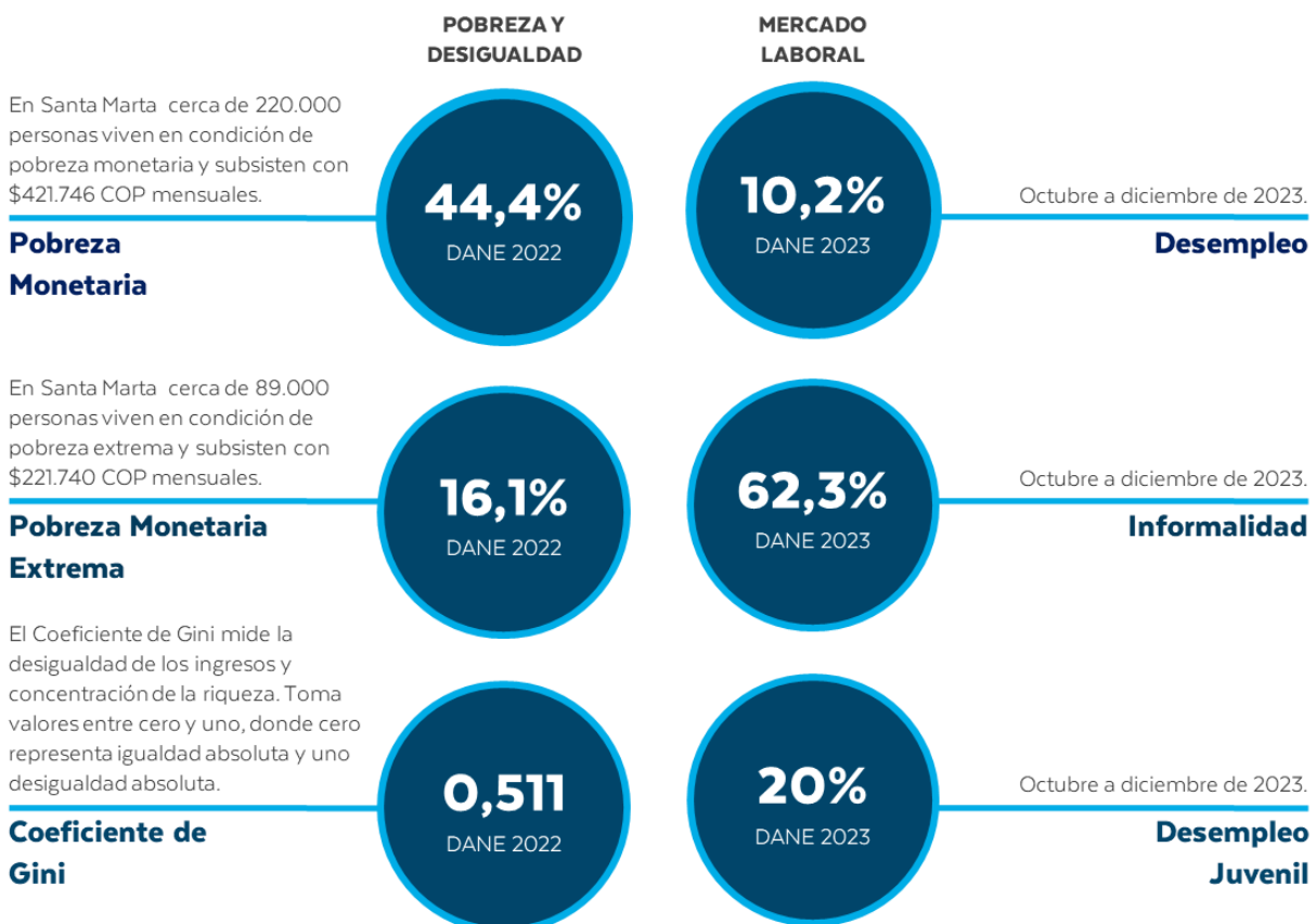
Ilustración 2. Indicadores Monetarios y del Mercado Laboral en Santa Marta

De acuerdo a la Unidad Administrativa del Servicio Público de Empleo - UASPE (2023), en Santa Marta existen 3.698 empresas privadas que encuentran registradas (Sistema de información del servicio público de empleo - SISE) de las cuales el 71% son microempresas (hasta 10 empleados) y para atender la demanda laboral, la Unidad reporta 57.066 personas registraron en los últimos 6 años, su hoja de vida en este servicio.